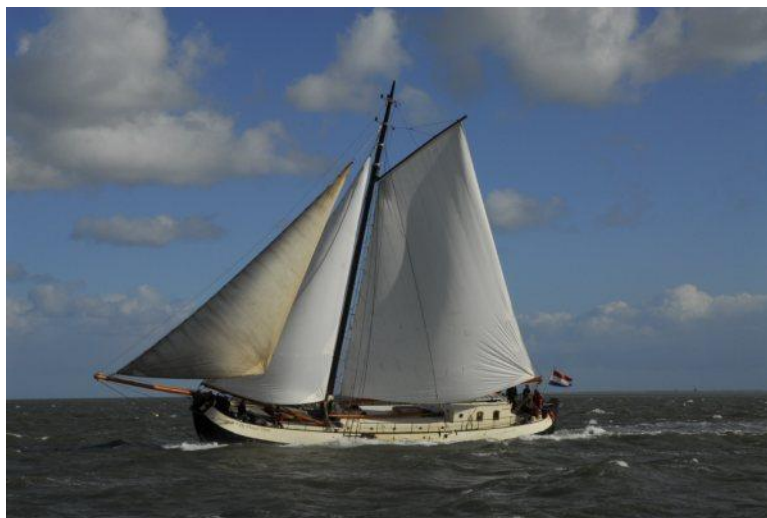
De Vrouw Dina onder zeil

Het thema van Sail 2010 is: Een nautische ontmoeting tussen verleden, heden en toekomst. Hoe kunt u deze ervaring beter ondergaan dan door een bezoek aan het evenement met De Vrouw Dina , de in 1897 gebouwde Overijsselse zeetjalk van ruim 24 meter, die na vijf jaar van intensieve restauratie, weer volledig onder zeil is!