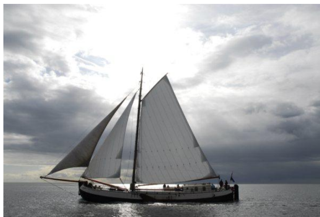
De Vrouw Dina zeilend op de Waddenzee